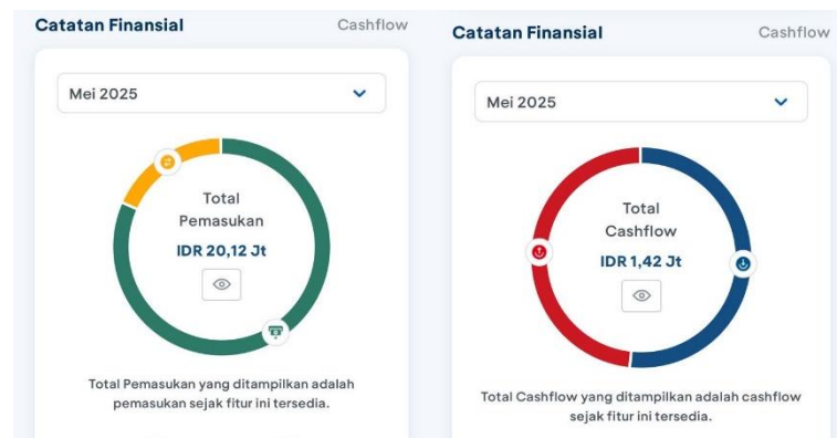
Gambar 4. Fitur Cashflow Pada M-Banking