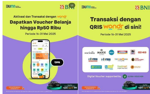
Gambar 2. Contoh Promo Belanja QRIS Wondr BNI

di OVO, Dana dan sejenisnya lah. Jadi, sering juga liat-liat promo di sosial media yang menggunakan QRIS atau dompet digital, akhirnya cobain promo yang hanya berlaku untuk pembayaran digital.” (Informan 21 Gilang)